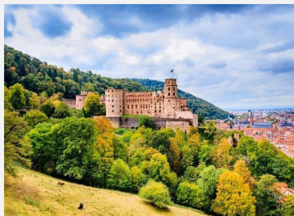
Το κάστρο της Χαϊδελβέργης