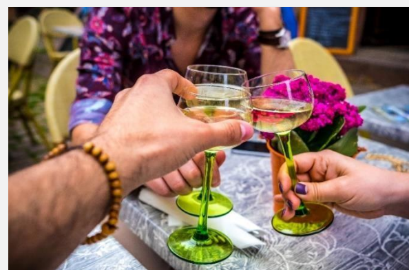
Κρασί Αλσατίας στην υγεία σας!