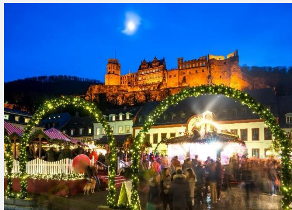
Η χριστουγεννιάτικη αγορά της Χαϊδελβέργης

Το παραπάνω πρόγραμμα είναι ενδεικτικό. Το τελικό ενημερωτικό αποστέλλεται περίπου 3-5 ημέρες πριν από την εκάστοτε αναχώρηση.